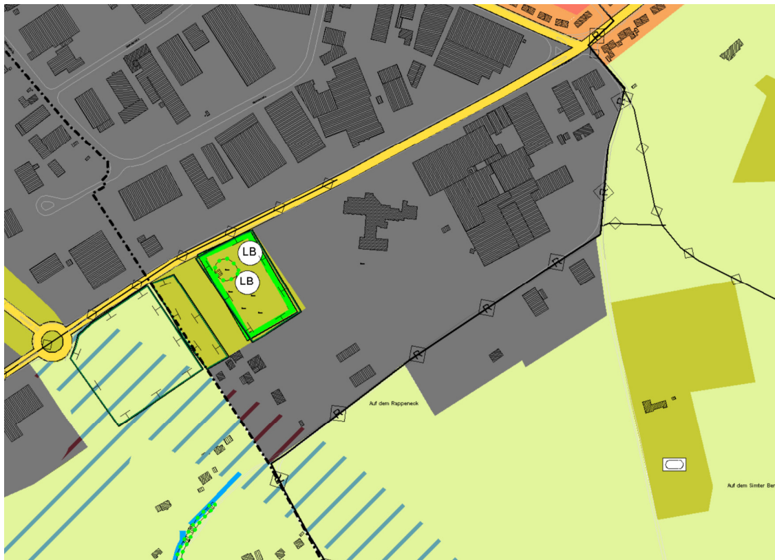
Abbildung 1: Ausschnitt aus dem FNP (2020)

Der Flächennutzungsplan der Stadt Pirmasens wurde mit Bekanntmachung am 28.03.2020 wirksam. Das Plangebiet ist als gewerbliche Baufläche dargestellt.